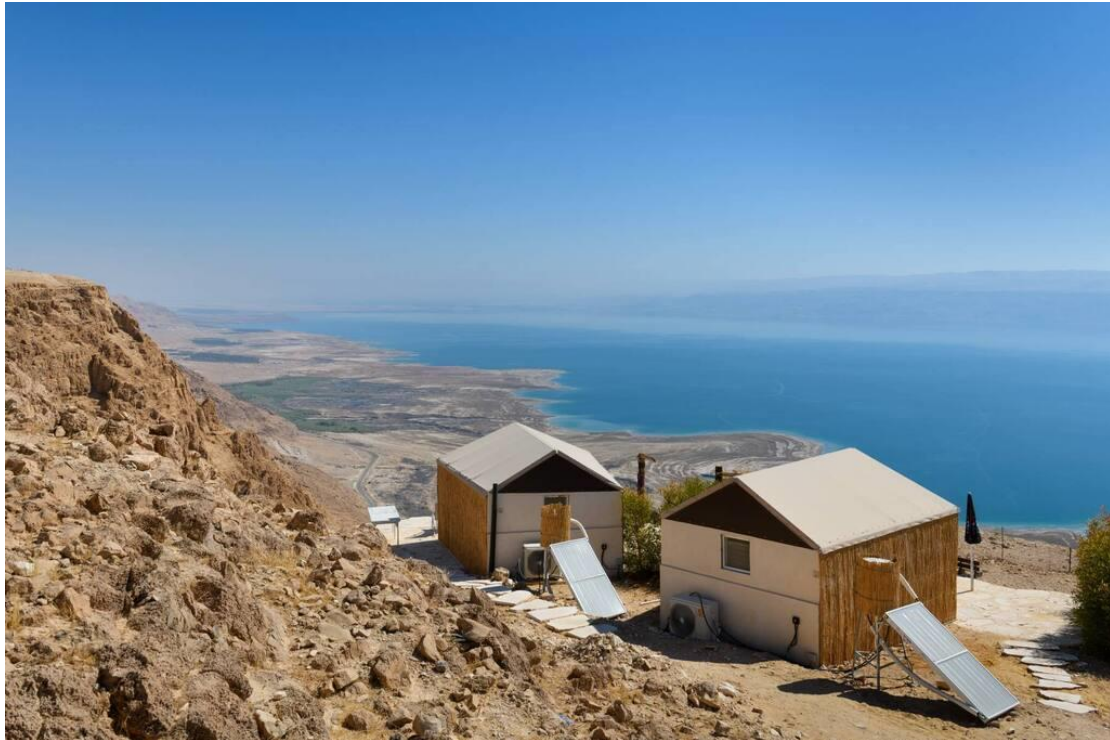
כפר המטיילים מצוקי דרגות

הפנינה היא ללא ספק החדר שנקרא "מול הים" ממש על קצה הצוק, מול הנוף, מבודד באמצעות גדר במבוק. יש בכפר כל השירותים הנדרשים למטיילים וגם בר-קפה שמציע תפריט פשוט ובירה ביתית מאוד טעימה שעשויה מתמרים.