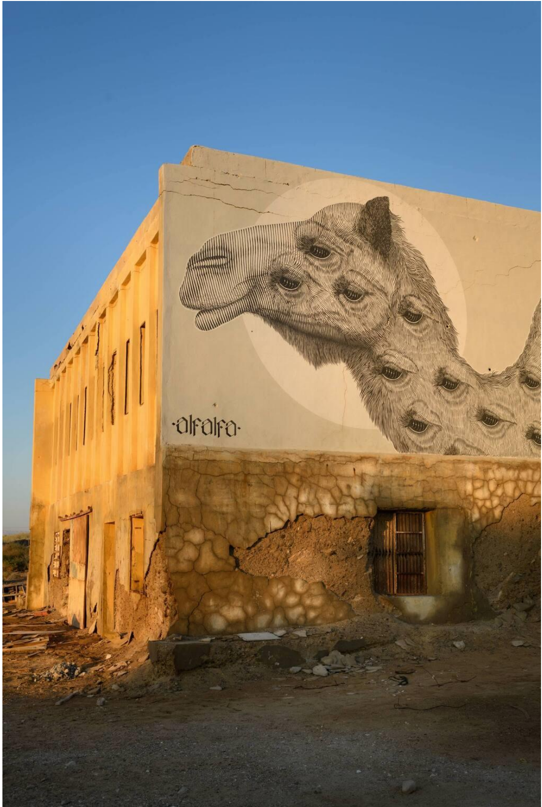
אמני גרפיטי מהארץ ומהעולם הגיעו לכאן

"בהתחלה צבענו את המבנים הכי קרובים לחוף. משם הדברים התחילו להמריא. עשינו כחמישה שנים של צביעה. דרך גיוסי תרומות אנחנו משלמים את כל ההוצאות של האמנים,