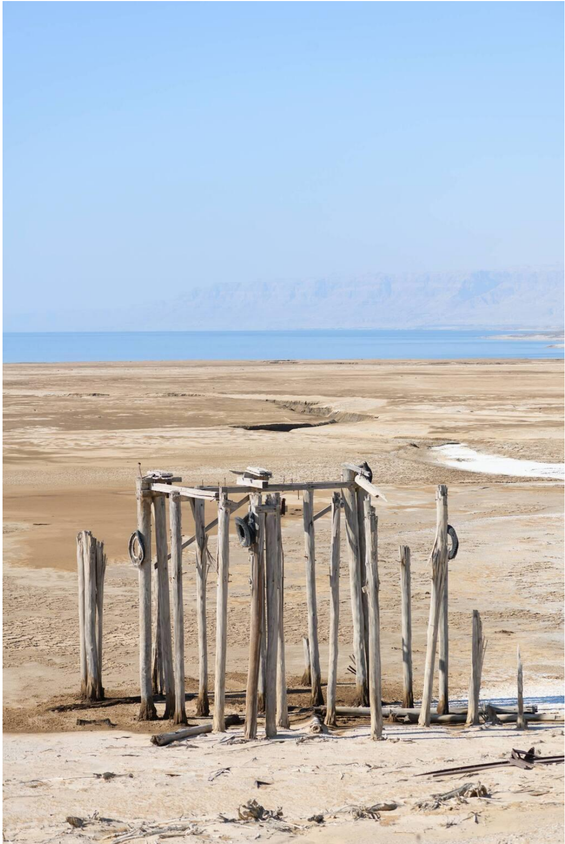
שאריות המזח העתיק - עדות לנסיגת הים

בדרך אפשר לראות גם את מסעדת הלידו הנטושה, שנבנתה בתקופה הירדנית ועברה לידיים ישראליות ב-1967, פעלה עד סוף 1982 ונסגרה יחד עם נסיגת הים. על קירות המסעדה עדיין