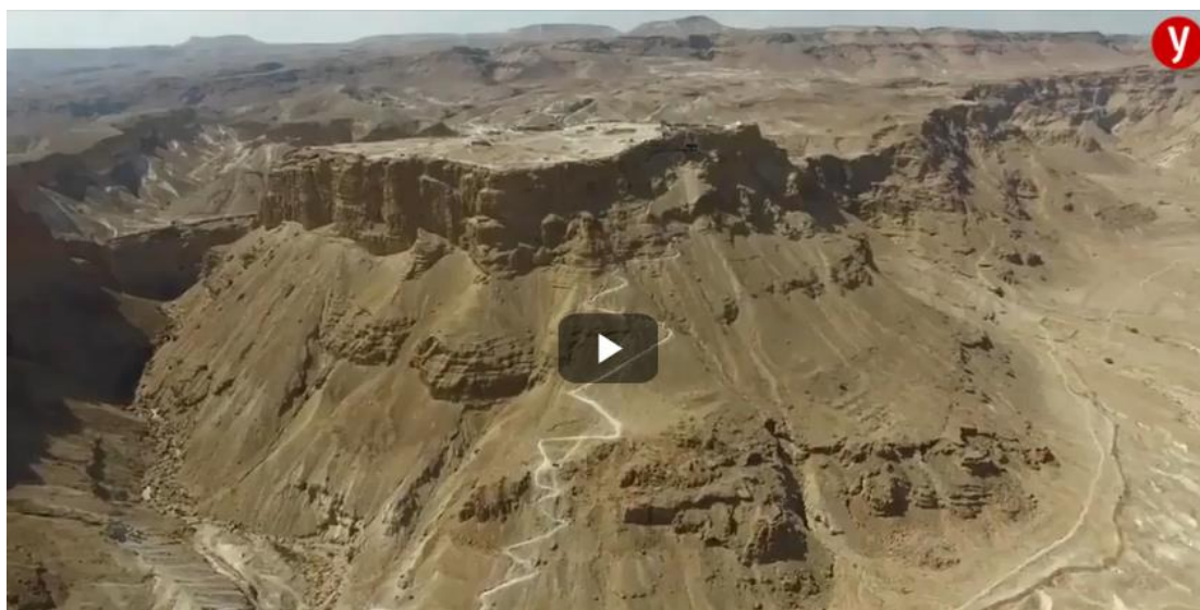
טיול בצפון ים המלח

חוץ מהעבודה עם תיירים, שמואלפלד ובן-זקן מתפקדים גם כיחידת חילוץ באזור. "פעם-פעמיים בחודש מחלצים מכאן מישהו, גם מהמים וגם מהחוף, כי יש אזורים שנגישים רק מהמים", מספר שמואלפלד. "בליעה של כוס אחת של מי הים הזה היא כמו הכשה של נחש צפע מבחינת הפגיעה במערכת העצבים. מצב הים יכול להשתנות בן-רגע, ואי אפשר לשחות בו כמו בים רגיל, כי הרגליים צפות גבוה ובקושי מתפקדות."