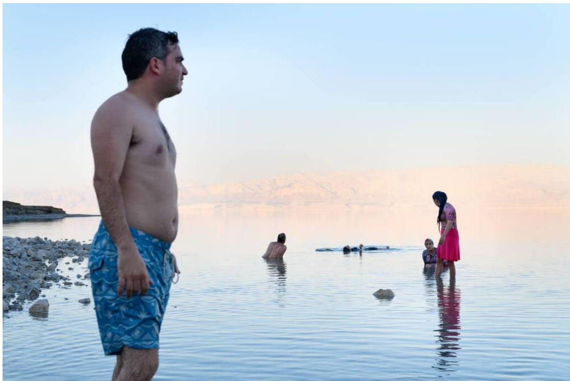
"אפשר להרגיש זרמים חמים במים". חוף עין קדם

באזור עין קדם, סמוך לשפך נחל קדם, חמישה ק"מ צפונה מעין גדי, נובעים עשרות מעיינות חמים, שנמצאים בתהליך קבוע של שינוי, גם במיקומם וגם בגודלם, והם מוכרים לרבים. אלה שנובעים מבטן האדמה חמים מאוד (עד 45 מעלות) ומלוחים מאוד, ונעימים מאוד לטבילה בימים קרירים (חשוב להביא מים כדי להישטף בסוף הרחצה). יש גם מעיינות קרירים הנובעים ממי האקוויפר, שמקבל את מימיו מהגשמים היורדים בהרי ירושלים וחברון, והם יותר מתאימים לימים חמים.