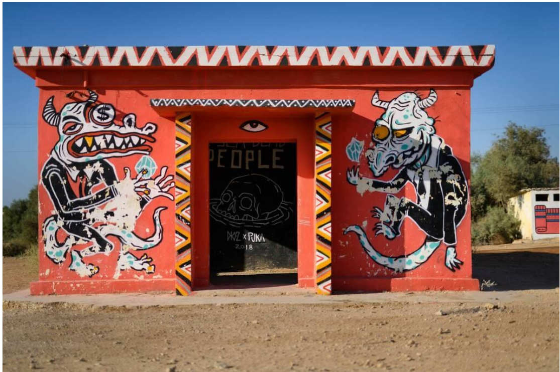
יצירה של Dioz & Puka בגלריה מינוס 430 בחוף קליה